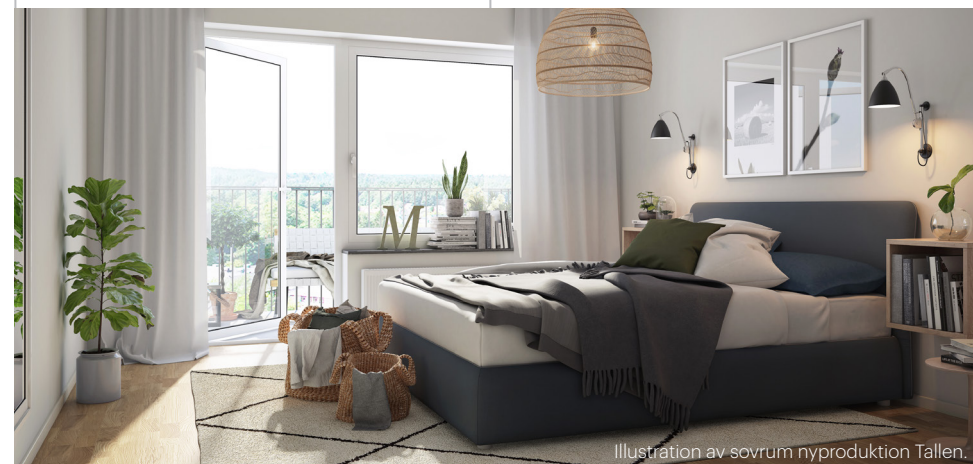
Illustration av sovrum nyproduktion Tallen.

I så fall dra ur utrustning och prova återställa igen. Går det återställa så är det fel på den utrustning som sattes in i uttaget.