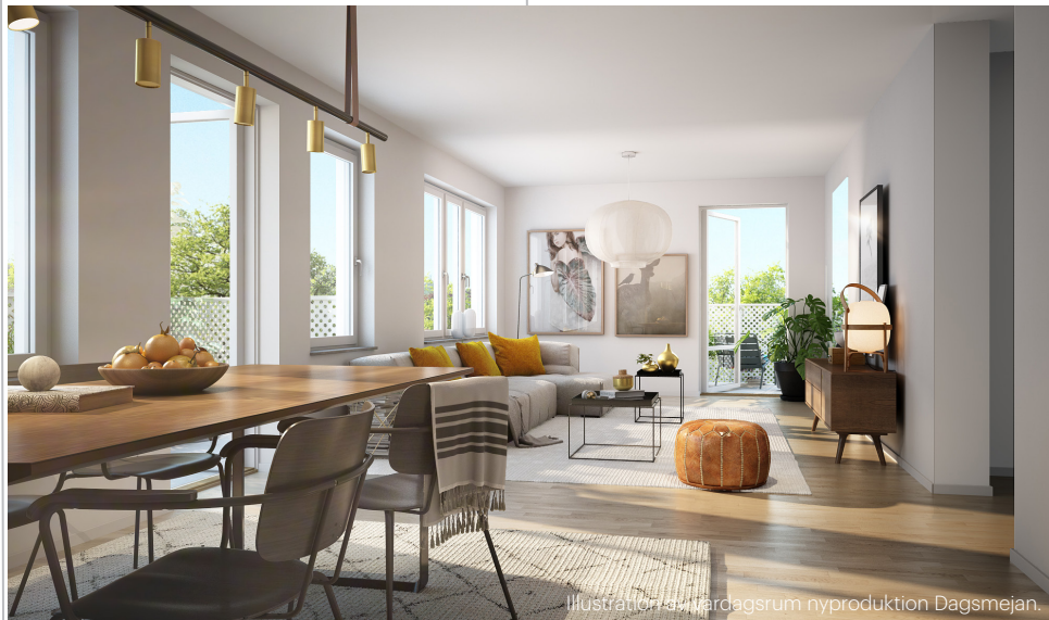
Illustration av vardagsrum nyproduktion Dagsmejan.