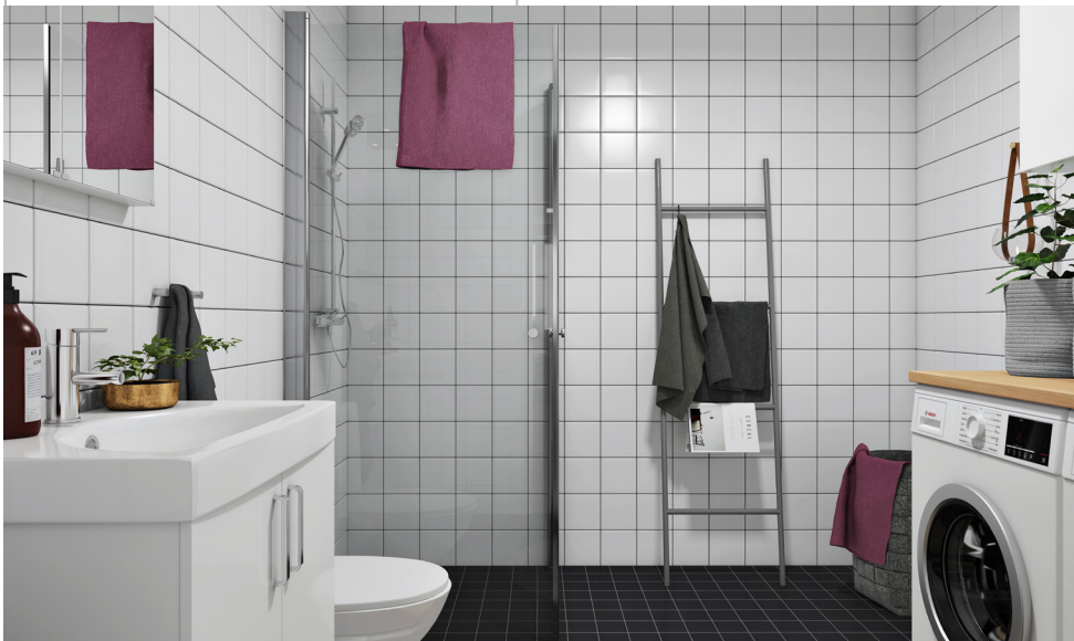
Illustration över ett badrum, observera att badrum kan se olika ut beroende på var du bor.

Välkommen till ditt nya boende! Ett badrum behöver omsorg för att hålla sig fräscht och fint över tid. Här följer några praktiska råd om hur du bäst sköter om och rengör ditt badrum.